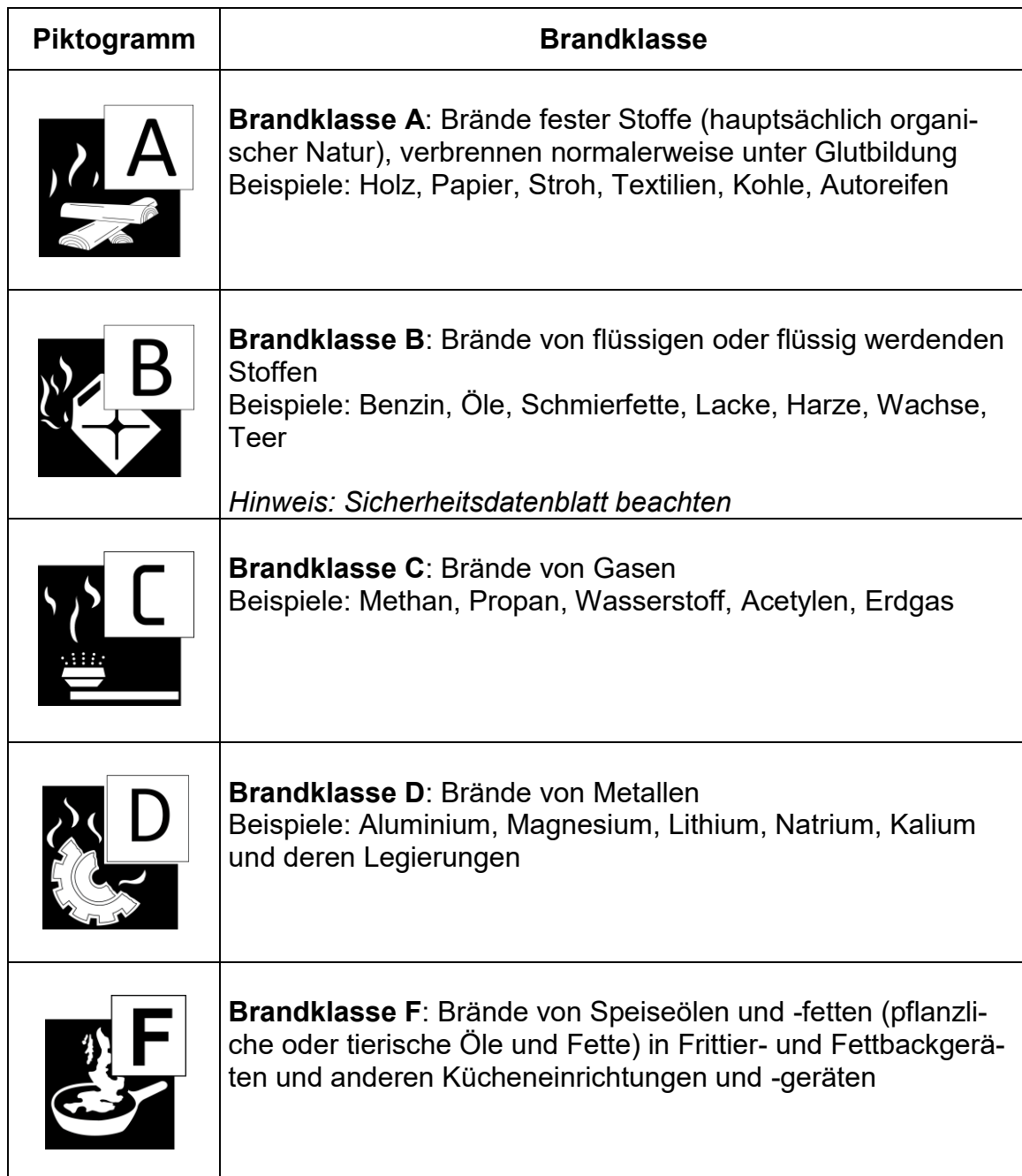
Tabelle 1: Brandklassen nach DIN EN 2:2005-01 „Brandklassen“, Piktogramme nach DIN EN 3-7:2007-10 „Tragbare Feuerlöscher - Teil 7: Eigenschaften, Leistungsanforderungen und Prüfungen“

Für Brände von elektrischen Anlagen und Betriebsmitteln wird in DIN EN 2:2005-01 „Brandklassen“ keine eigenständige Brandklasse ausgewiesen.