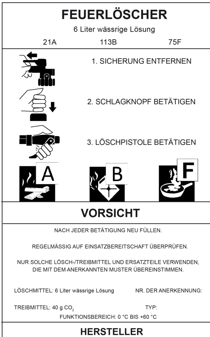
Abb. 1: Beispiel für die Beschriftung eines Feuerlöschers durch den Hersteller, in Anlehnung an DIN EN 3-7:2007-10 „Tragbare Feuerlöscher - Teil 7: Eigenschaften, Leistungsanforderungen und Prüfungen“

(1) Das Löschvermögen wird durch eine Zahlen-Buchstabenkombination auf dem Feuerlöscher angegeben. In dieser Zahlen-Buchstabenkombination bezeichnet die Zahl die Größe des erfolgreich abgelöschten Norm-Prüfobjektes und der Buchstabe die Brandklasse (siehe Abbildung 1).